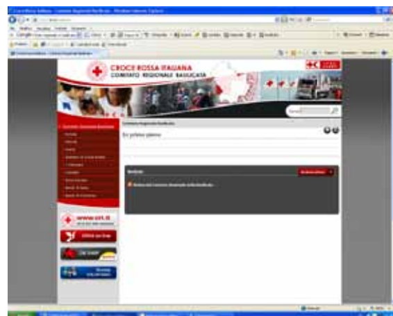
Esempio del passaggio di un sito regionale al nuovo format web