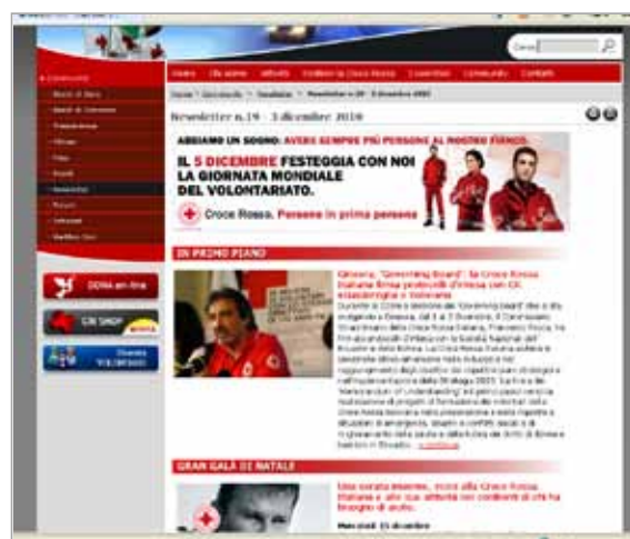
Esempio di Newsletter